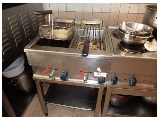
Slika broj 3-22 -Inventarni broj 256