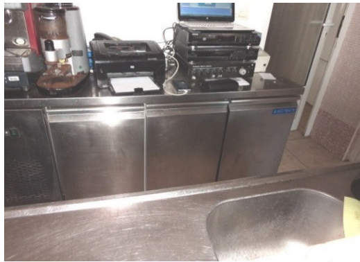
Slika broj 3-9 -Inventarni broj 163