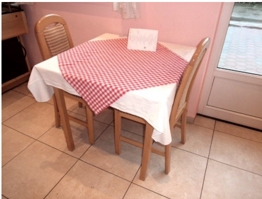
Slika broj 3-27 -Inventarni broj 3209