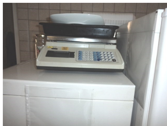
Slika broj 3-44 -Inventarni broj 264