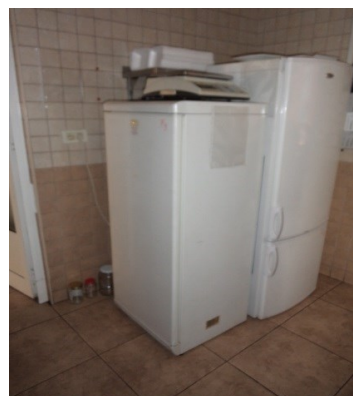
Slika broj 3-20 -Inventarni broj 239