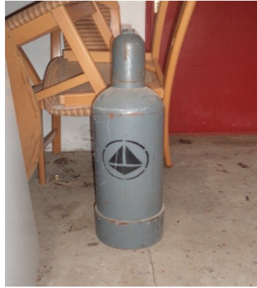
Slika broj 3-8 -Inventarni broj 162