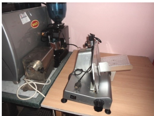
Slika broj 3-41 -Inventarni broj 157