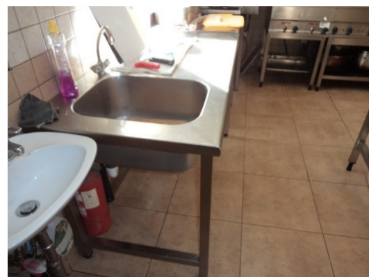
Slika broj 3-14 -Inventarni broj 201