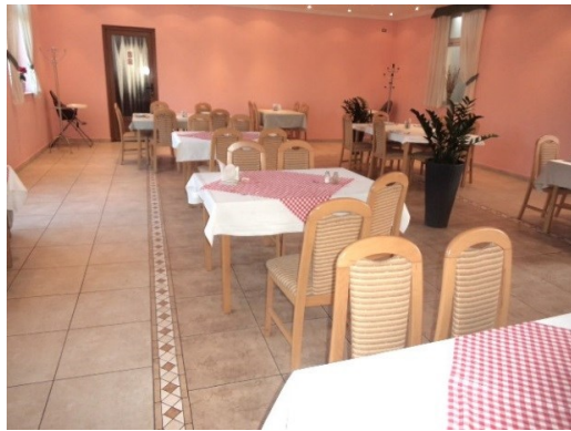
Slika broj 3-25 -Inventarni broj 3208 i 3210