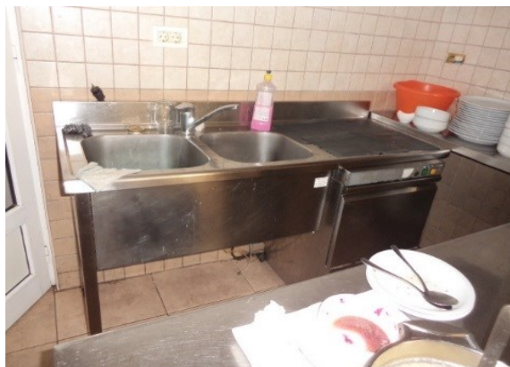
Slika broj 3-2 -Inventarni broj 149 i 166