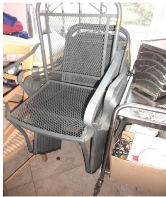
Slika broj 3-33 -Inventarni broj 3498