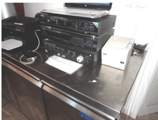
Slika broj 3-45 -Inventarni broj 275