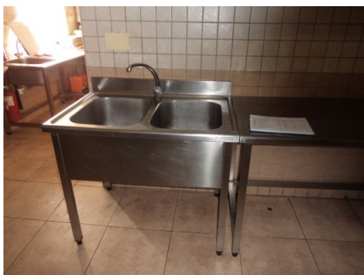
Slika broj 3-21 -Inventarni broj 255