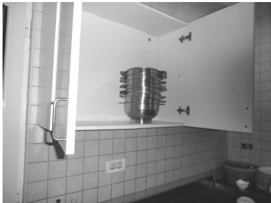
Slika broj 3-29 -Inventarni broj 3297