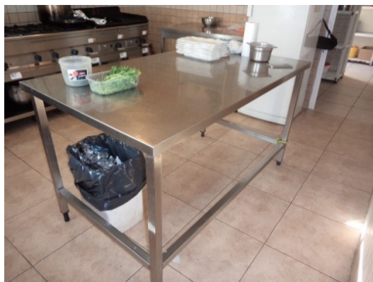
Slika broj 3-39 -Inventarni broj 322