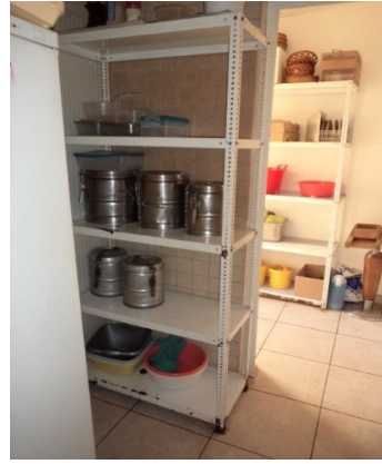
Slika broj 3-24 -Inventarni broj 3555