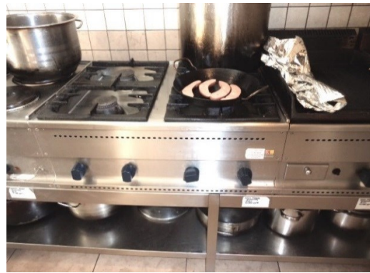
Slika broj 3-10 -Inventarni broj 164