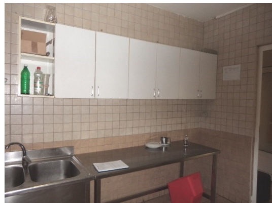
Slika broj 3-12 -Inventarni broj 177,178 i 179