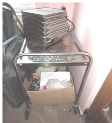
Slika broj 3-16 -Inventarni broj 211 i 212