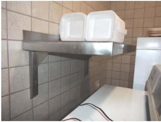
Slika broj 3-31 -Inventarni broj 3473