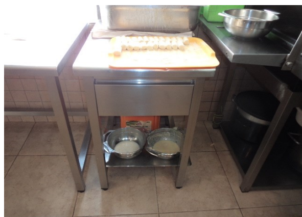
Slika broj 3-5 -Inventarni broj 153