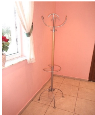
Slika broj 3-36 -Inventarni broj 3604