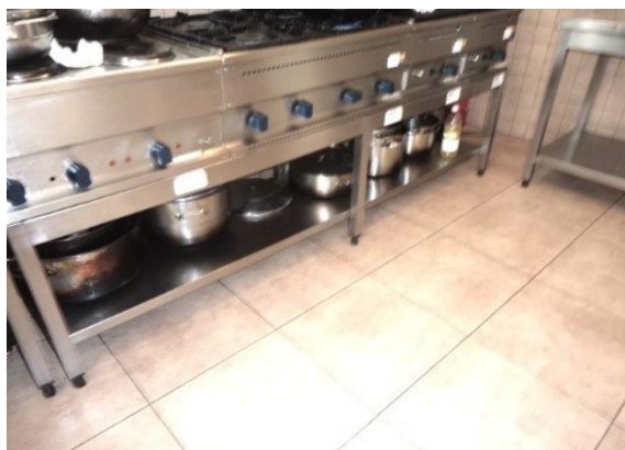
Slika broj 3-1 -Inventarni broj 147