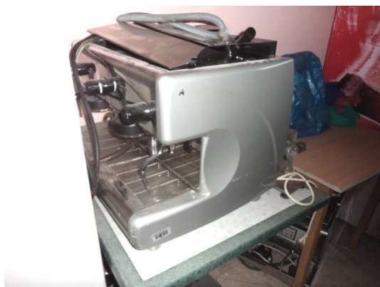
Slika broj 3-43 -Inventarni broj 172