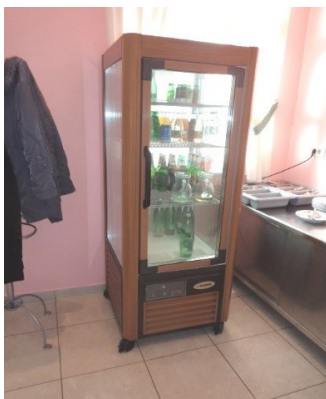
Slika broj 3-37 -Inventarni broj 287