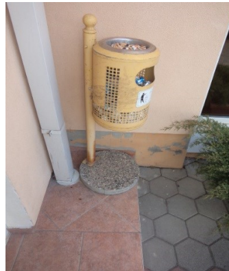
Slika broj 3-34 -Inventarni broj 3500