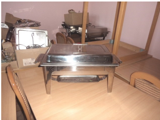
Slika broj 3-35 -Inventarni broj 3584 i 348