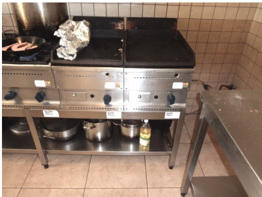
Slika broj 3-11 -Inventarni broj 165 i 337