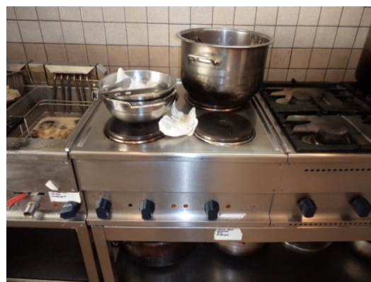
Slika broj 3-38 -Inventarni broj 289