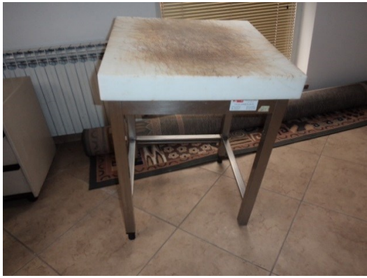
Slika broj 3-7 -Inventarni broj 155