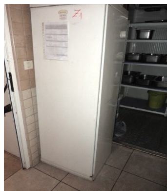
Slika broj 3-42 -Inventarni broj 168