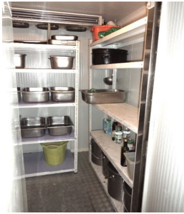
Slika broj 3-23 -Inventarni broj 3555