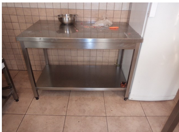
Slika broj 3-3 -Inventarni broj 150