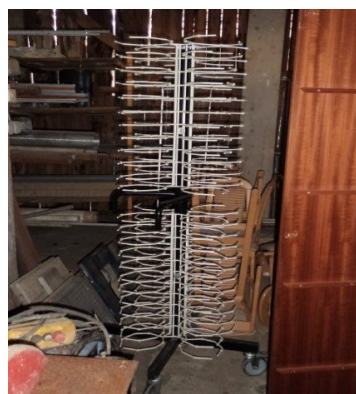
Slika broj 3-18 -Inventarni broj 230