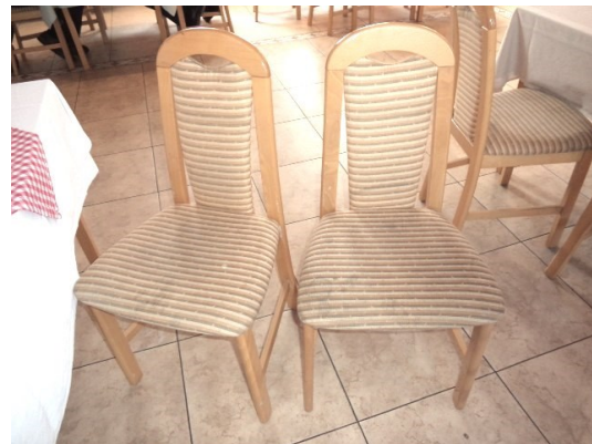
Slika broj 3-28 -Inventarni broj 3210