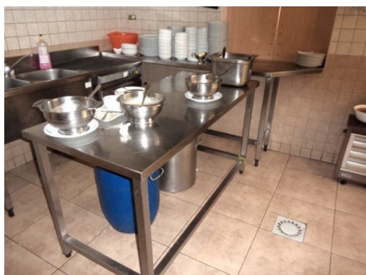
Slika broj 3-17 -Inventarni broj 223 i 257