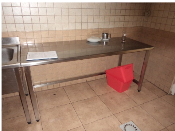
Slika broj 3-6 -Inventarni broj 153