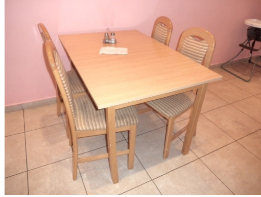
Slika broj 3-26 -Inventarni broj 3208