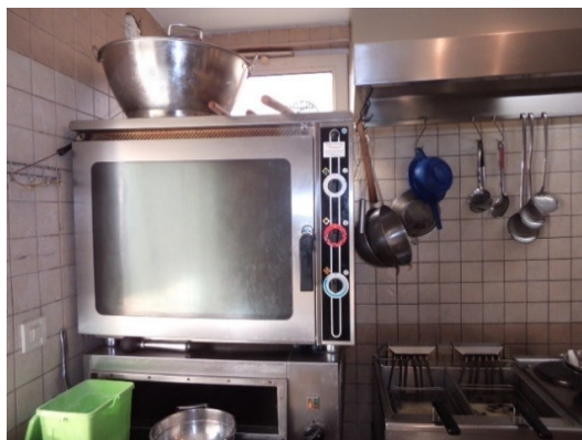
Slika broj 3-15 -Inventarni broj 209 i 222