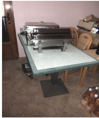
Slika broj 3-32 -Inventarni broj 3497