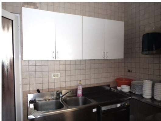
Slika broj 3-13 -Inventarni broj 180 i 181