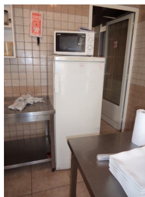
Slika broj 3-46 -Inventarni broj 239