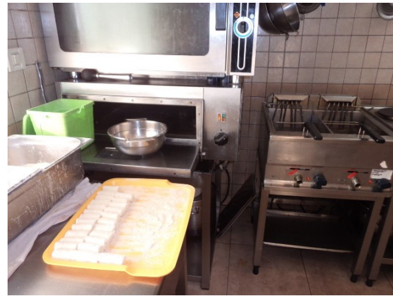
Slika broj 3-4 -Inventarni broj 151 i 152