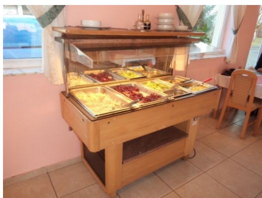
Slika broj 3-19 -Inventarni broj 238