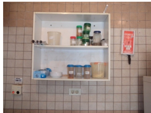
Slika broj 3-30 -Inventarni broj 3372